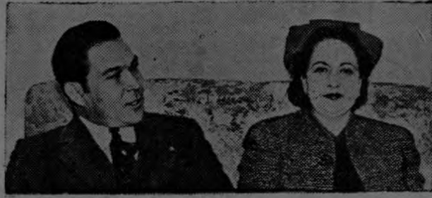
El Excelentísimo señor Presidente de Cuba, General Batista, en compañía de su gentil y bella esposa.

El General Fulgencio Batista actual Presidente de la hermana República de Cuba, comprendió con un espíritu ampliamente abierto a la realidad, la justicia de conceder a las mujeres de su patria el derecho de voto. Gesto que lo consagrará para siempre como uno de los hombres más conscientes de sus deberes ciudadanos. Dos mujeres y siete diputadas honran las Cámaras cubanas y son las alcaldesas municipales. Un dato interesante que será del agrado de nuestras lectoras es el de que en Quemado de Guirnes, Provincia de Santa Clara, los tres candidatos para Alcaldes son Mujeres.